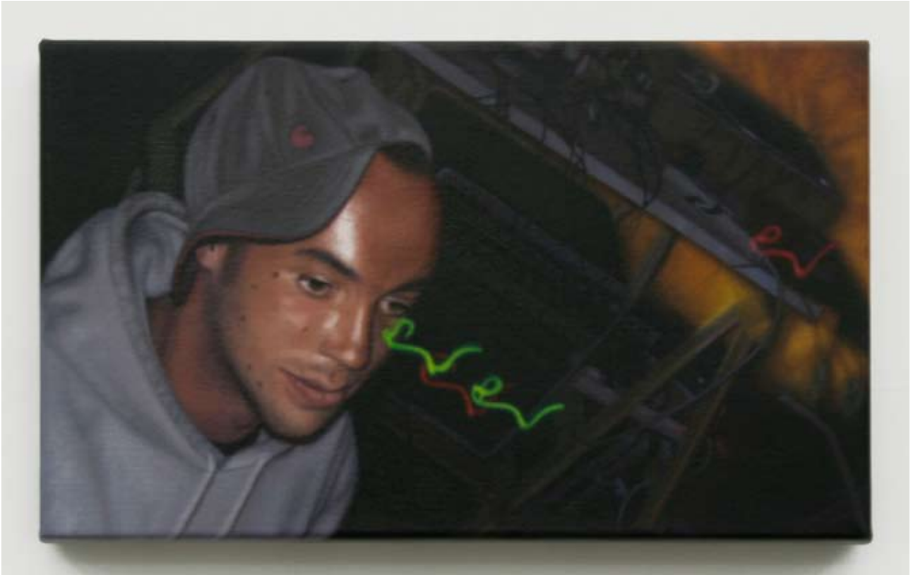
Audrey Nervi pierroman 2009 Huile sur toile 30 x 50 cm Pièce unique