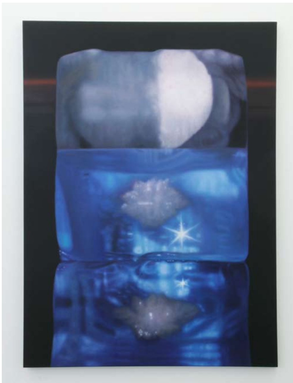
Audrey Nervi éphémère 2009 Huile sur toile 180 x 130 cm Pièce unique