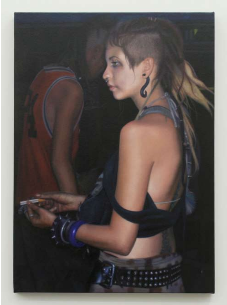
Audrey Nervi ambeli P4 - italie 2009 Huile sur toile 70 x 50 cm Pièce unique