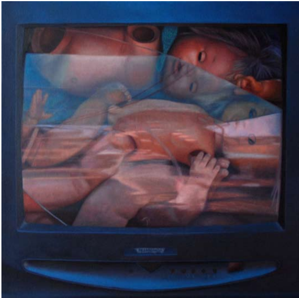
Audrey Nervi propaganda 2009 Huile sur toile 50 x 50 cm Pièce unique