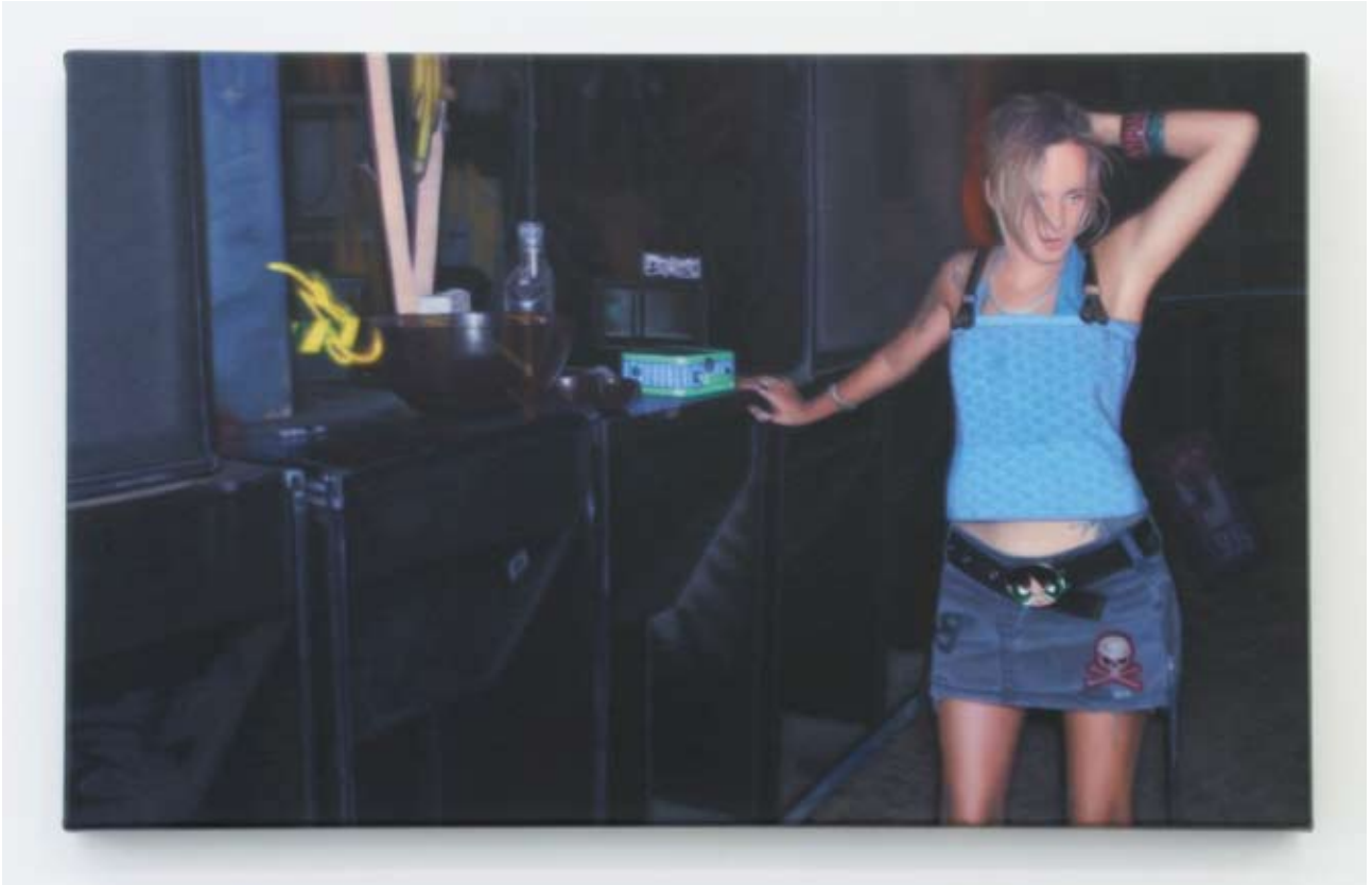
Audrey Nervi jojo, acid punch - bulgarie 2009 Huile sur toile 50 x 80 cm Pièce unique