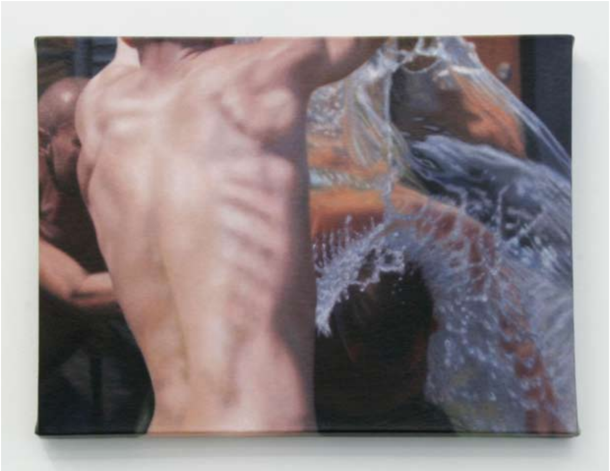
Audrey Nervi lose 2009 Huile sur toile 30 x 40 cm Pièce unique