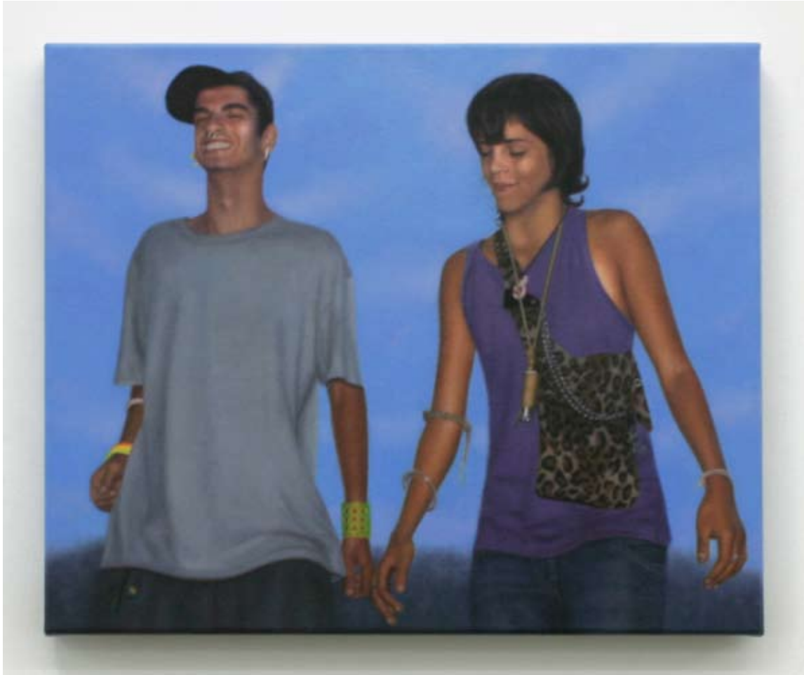
Audrey Nervi toni et alice 2009 Huile sur toile 50 x 60 cm Pièce unique