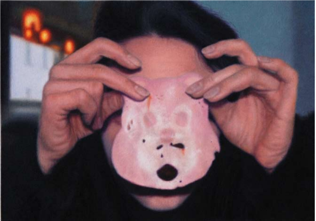
Audrey Nervi mortadelle - berlin 2009 Huile sur toile 20 x 28 cm Pièce unique