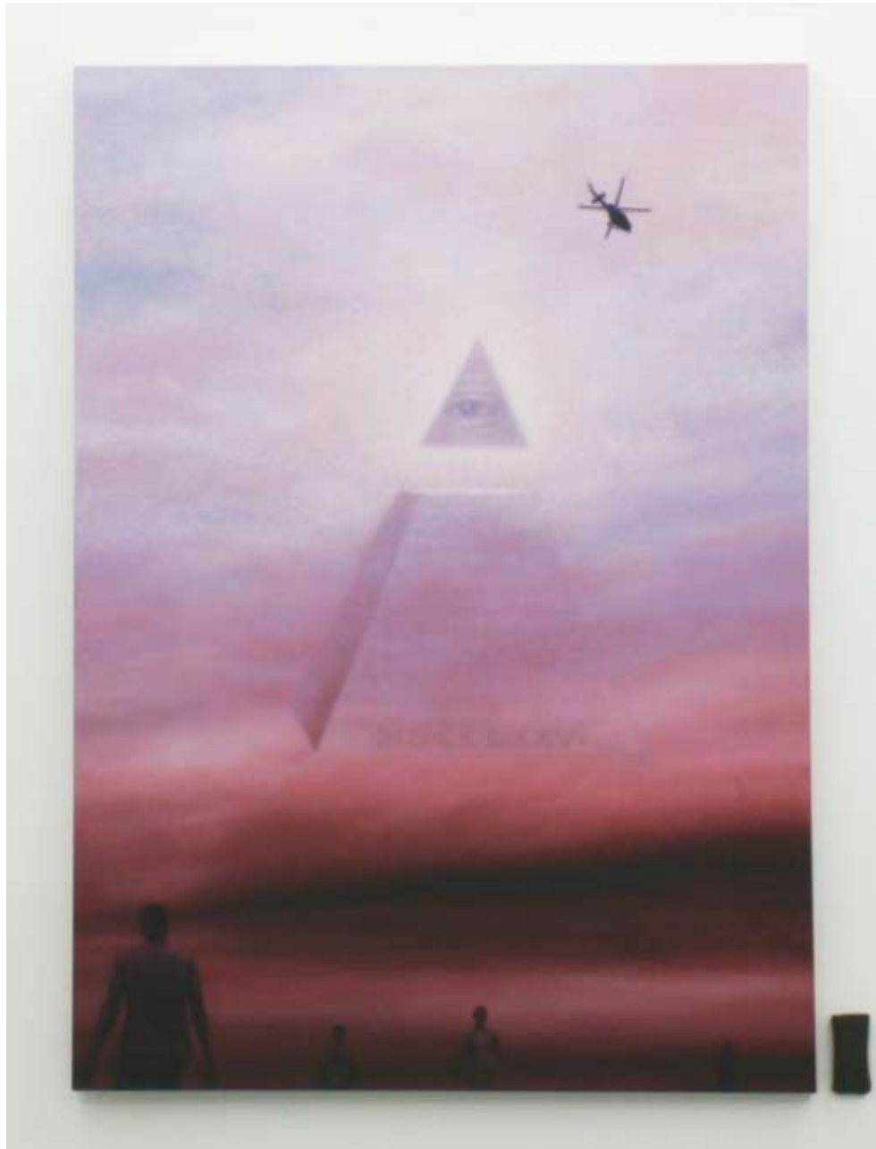
Audrey Nervi nouvel ordre mondial 2009 Huile sur toile 180 x 130 cm Pièce unique