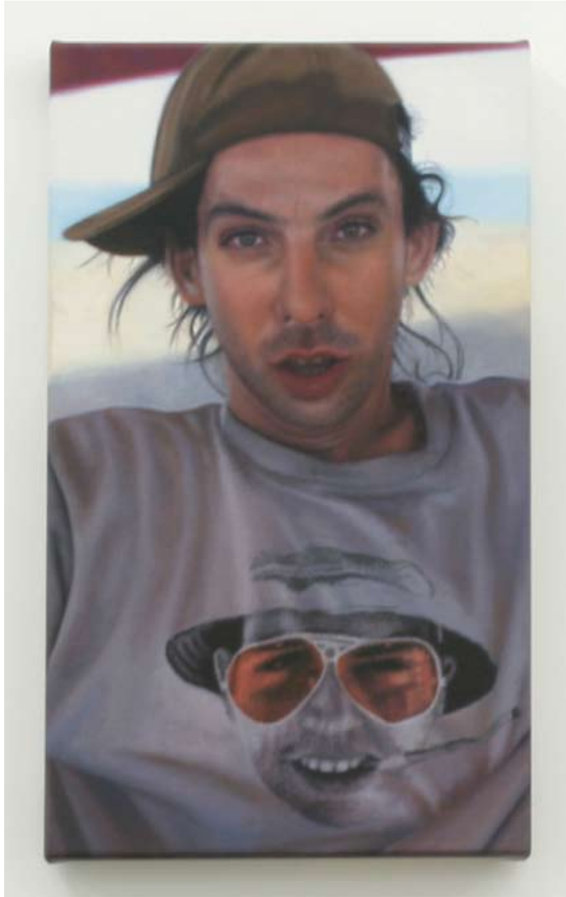
Audrey Nervi stev, las vegas parano - bulgarie 2009 Huile sur toile 50 x 30 cm Pièce unique