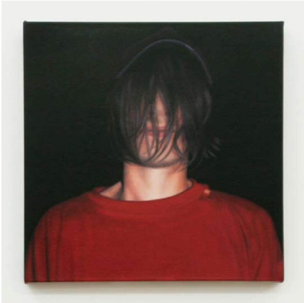
Audrey Nervi joris bipolaire - italie 2009 Huile sur toile 40 x 40 cm Pièce unique