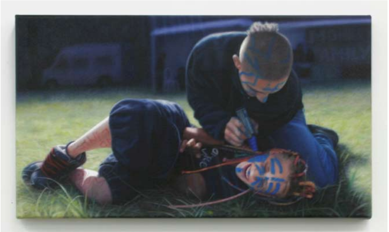
Audrey Nervi flo & julien - bulgarie 2009 Huile sur toile 40 x 70 cm Pièce unique