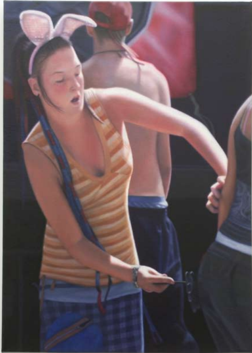
Audrey Nervi fée C 2009 Huile sur toile 70 x 50 cm Pièce unique