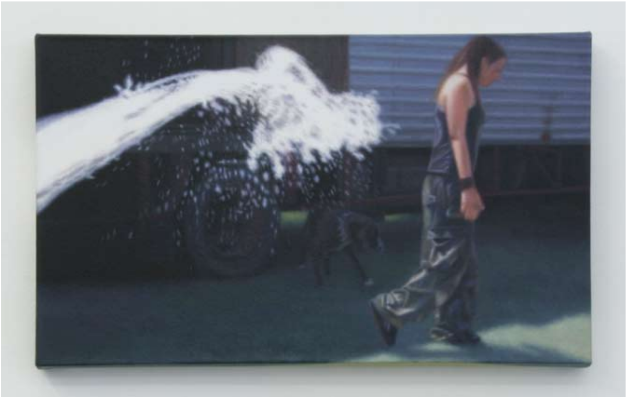
Audrey Nervi lost 2009 Huile sur toile 30 x 50 cm Pièce unique