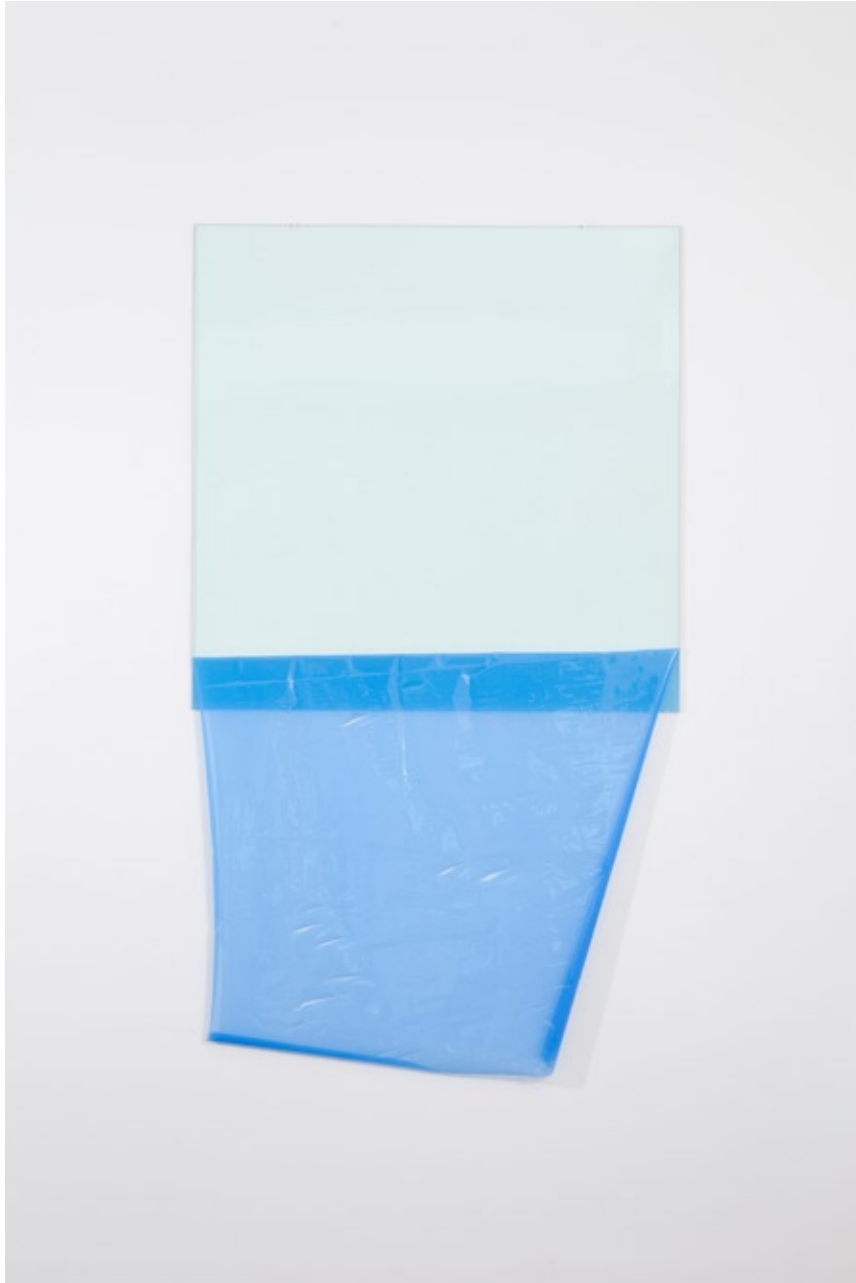
Gyan Panchal kutis 2 2009 Plexiglas, masking film 175 x 100 cm Unique