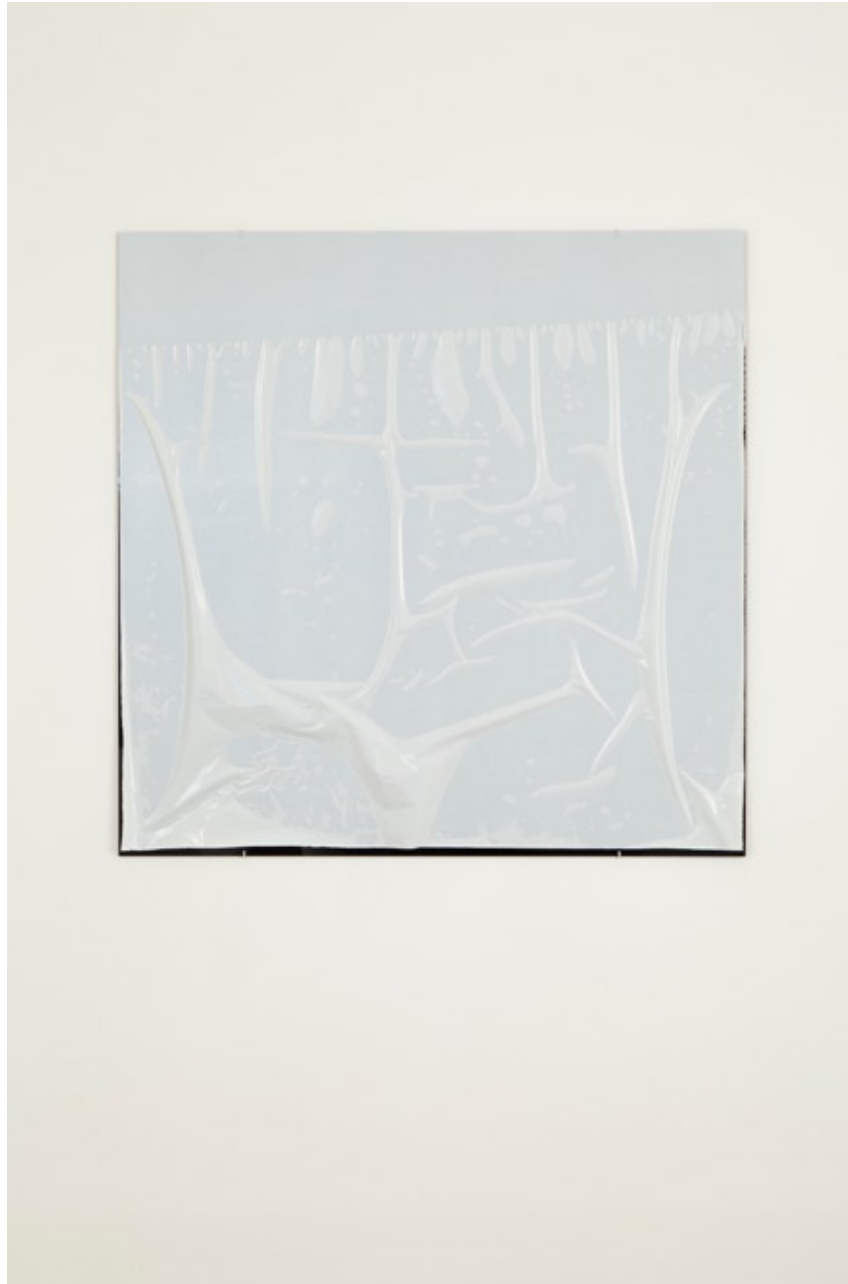
Gyan Panchal kutis 1 2009 Plexiglas, masking film 100 x 100 cm Unique